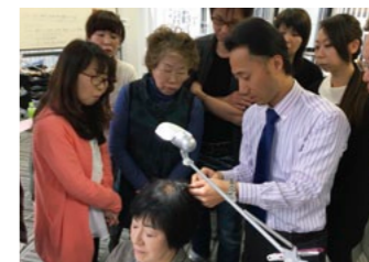
TZK増毛技術責任者として、全国の皆様に生きた技術をお伝えしています

【TZK増毛技術を始めたきっかけは?】 左のページでご紹介があるとおり、父の病気がきっかけで修行先から急きょお店に戻り、父の不在中お客様の対応をしたのが始まりでした。