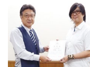
TZK増毛マスターとして 全国で講師としても活躍中